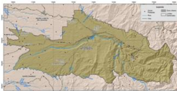
Figura 1. Mapa de ubicación de San Miguel de los Bancos

Administrativamente, San Miguel de los Bancos es uno de los ocho cantones que integran la provincia de Pichincha y está conformado por dos parroquias: la cabecera cantonal de San Miguel de los Bancos y la parroquia de Mindo, reconocida por su importancia ecológica y turística. Sus límites geográficos son: al norte, el Distrito Metropolitano de Quito y el cantón Pedro Vicente Maldonado; al sur, la provincia de Santo Domingo de los Tsáchilas; al este, el Distrito Metropolitano de Quito; y al oeste, la provincia de Santo Domingo de los Tsáchilas. Estas características geográficas y ambientales hacen de San Miguel de los Bancos un territorio especialmente relevante para el análisis de la vulnerabilidad y los efectos asociados al cambio climático.