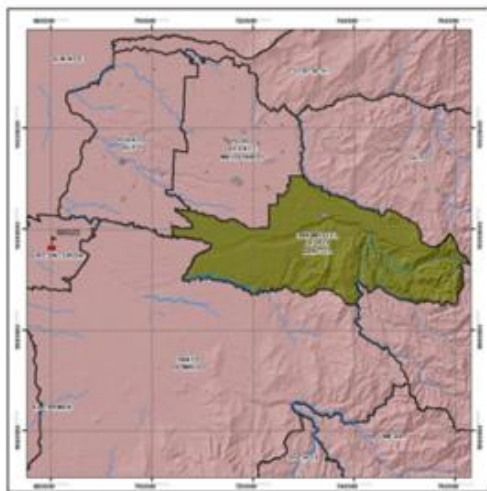
Figura 2. Mapa de ubicación de las estaciones meteorológicas convencionales

información completa en el periodo 1990 - 2015.