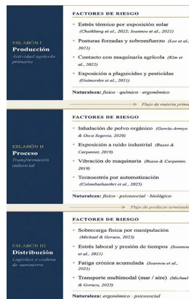
Figura 5: Riesgos laborales en la cadena agroalimentaria

trabajadores (Dos Santos et al., 2021; Yan et al., 2022). Este planteamiento coincide con (Aby et al., 2024), los cuales indican que la combinación de maquinaria peligrosa, exposición ambiental y carencia de cultura preventiva en la agroindustria aumenta los índices de siniestralidad. En la actualidad, bajo el paradigma de la Industria 5.0, el riesgo laboral trasciende su conceptualización tradicional a una variable de desempeño sistémico como lo afirma Spieth et al. (2014) y Nahavandi (2019) pues integra de forma transversal en la cadena de suministro, la inteligencia artificial, análisis predictivo y el despliegue de sensores para su análisis, evaluación y prevención. La evidencia científica clasifica los riesgos laborales en la cadena de suministro bajo una taxonomía de cinco categorías: físicos, ergonómicos, químicos, biológicos y psicosociales (Jakob et al., 2021).