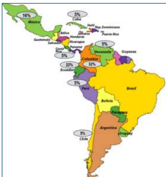
Figura 2. Porcentaje de publicaciones por países

de Ecuador 22%, México 16%, mientras que Chile, Paraguay, Perú, Cuba, Costa Rica y Venezuela se identificó el 5% de las investigaciones analizadas. Desde esta perspectiva, la fase de la ejecución de la revisión permitió ir organizando los datos e información, por criterios específicos de estudio en una matriz bibliográfica y de análisis de contenido, para el análisis y síntesis respectivo, conformando el estado del arte en el despliegue de hallazgos y sus reflexiones finales.