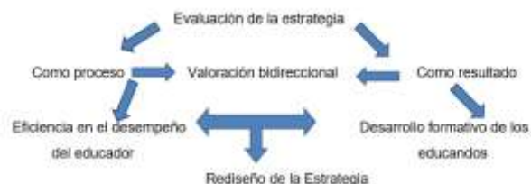
Figura 2. Evaluación de la estrategia

Las estrategias educativas tienen un sistema de exigencias metodológicas que presuponen su utilización.