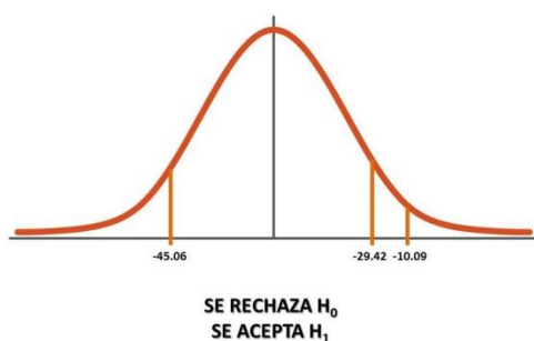
Ilustración 5. Gráfico de Decisión Prueba T Plank Test

De manera similar a los casos precedentes, este resultado permite reconocer que la aplicación del programa de ejercicios pliométricos permitió una mejora estadísticamente significativa en la aptitud física de los atletas, soportada en la mejora en un 7.50% de los tiempos de la prueba de Plank Test.