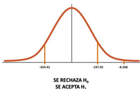
Ilustración 1. Gráfico de Decisión Prueba T Test de Cooper

Test de T. T calculado = 3.34: Este valor es menor al límite inferior de 9.41, por lo que se rechazaría la hipótesis nula, con lo cual se reconoce desde un punto de vista estadístico que el programa de ejercicios pliométricos genera cambios estadísticamente significativos en los atletas, validando así el 12.10% de variación de los tiempos promedios que se registraron de los individuos que participaron en los estudios.