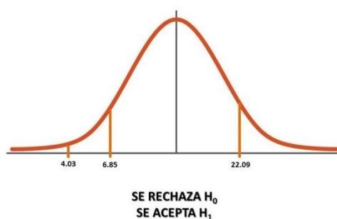
Ilustración 3. Gráfico de Decisión Prueba T Sprint de 40 metros

Sprint de 40 metros. T calculado = 4.03: Este valor es menor que el límite inferior de 6.85, por lo que se rechazaría la hipótesis nula. Ello demuestra que el programa de ejercicios pliométricos genera cambios significativos en la aptitud física de los atletas de una forma estadísticamente significativa, validando como probable la reducción promedio de 14.38% que reflejaron los atletas en la prueba Sprint de 40 metros.