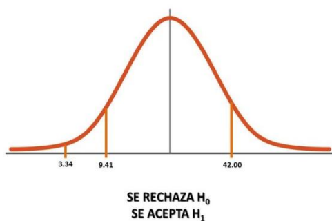
Ilustración 2. Gráfico de Decisión Prueba T Test de T

Ello coincide con los hallazgos de la investigación realizada por Villarreal et al. (2009) quienes en su estudio evaluaron los efectos del entrenamiento pliométrico en jugadores de baloncesto y encontraron mejoras significativas en la fuerza de las piernas. Los resultados mostraron un aumento del 12% en la altura del salto vertical y una reducción del 9% en el tiempo de la prueba Test de T.