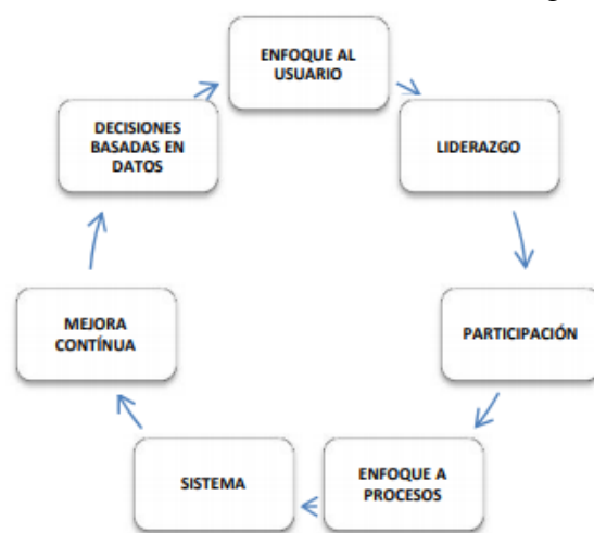
Figura 2 Principios Básicos de Gestión

La gestión en la educación está basada en un principio que involucra el liderazgo, la participación para la mejora continua y generar beneficios enfocados en el usuario (ver Figura 2).