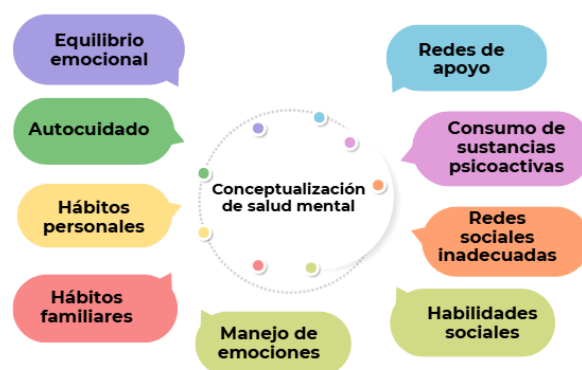
Figura 2. Conceptualización de salud mental

Asimismo, se identifica que la salud mental es entendida como un proceso cambiante, influenciado por las experiencias vividas durante la pandemia y el retorno a la presencialidad.