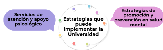
Figura 4. Estrategias que la Universidad puede implementar la Universidad para promover la salud mental.

Las redes de apoyo son reconocidas como un componente central del bienestar psicológico, los estudiantes mencionan principalmente a la familia, los amigos y algunos docentes como fuentes de acompañamiento emocional. Sin embargo, también se evidencian redes limitadas en ciertos casos, lo que puede generar sentimientos de soledad o inseguridad.