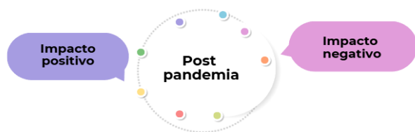
Figura 3. Impacto de la pandemia en la salud mental

Los participantes identifican tanto impactos positivos como negativos de la pandemia donde los impactos positivos se encuentran la revalorización de la interacción presencial, el fortalecimiento de la autonomía, el desarrollo de estrategias de autocuidado, la mejora en la comunicación familiar y una mayor preparación personal frente a las exigencias de la vida universitaria, estos hallazgos muestran que la experiencia pandémica no solo generó afectación, sino también procesos de aprendizaje y reorganización subjetiva.