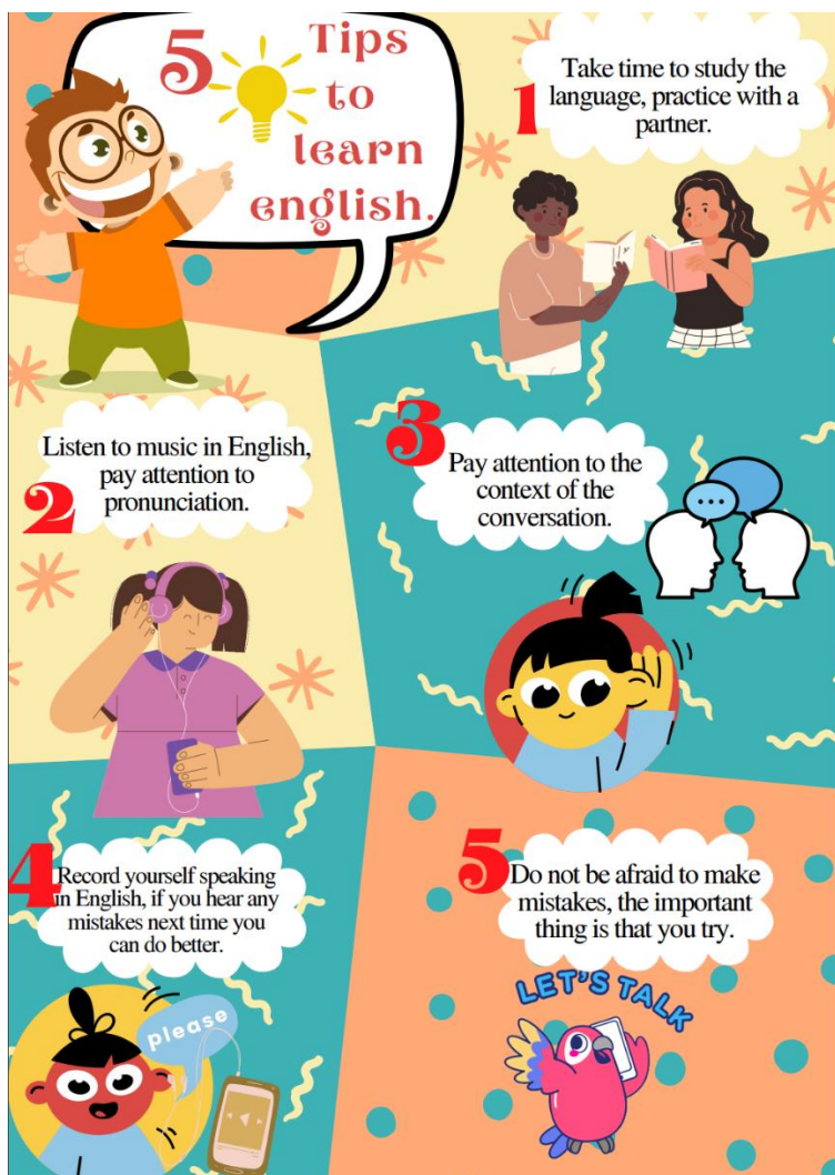
Figura 2 Volante creado por un grupo